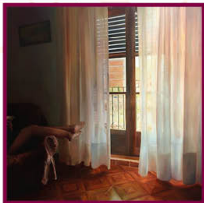
"La pausa" Autora: Sandra Valls Traver Mención Especial "Diego de Losada" 2023