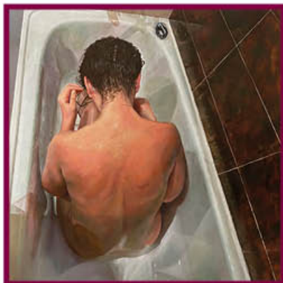
"El observador" Autor: Daniel Nuñez Pernas Mención Especial "Diego de Losada" 2023