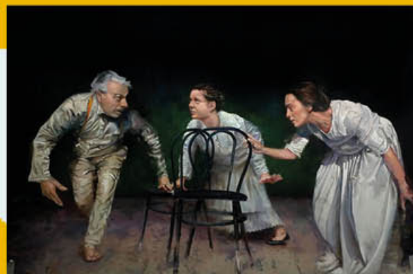
"Que no pare la música" - Autor: Jesús Martín Talón Premio Diego de Losada de Pintura 2023