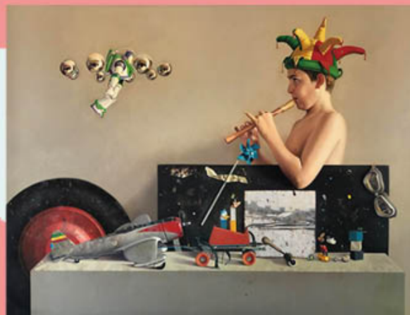
"El flautista y los muñecos" - Autor: Juan Carlos Gil Gutiérrez (Avila) Premio Diego de Losada de Pintura 2022