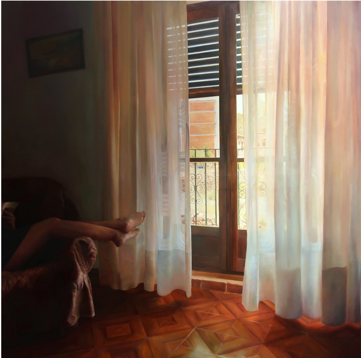
“LA PAUSA”. Primera Mención Especial Premio Diego de Losada de Pintura 2023