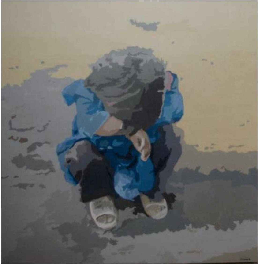
DECEPCION (Acrílico sobre madera). FINALISTA. Autor: PEDRO J. LORENTE