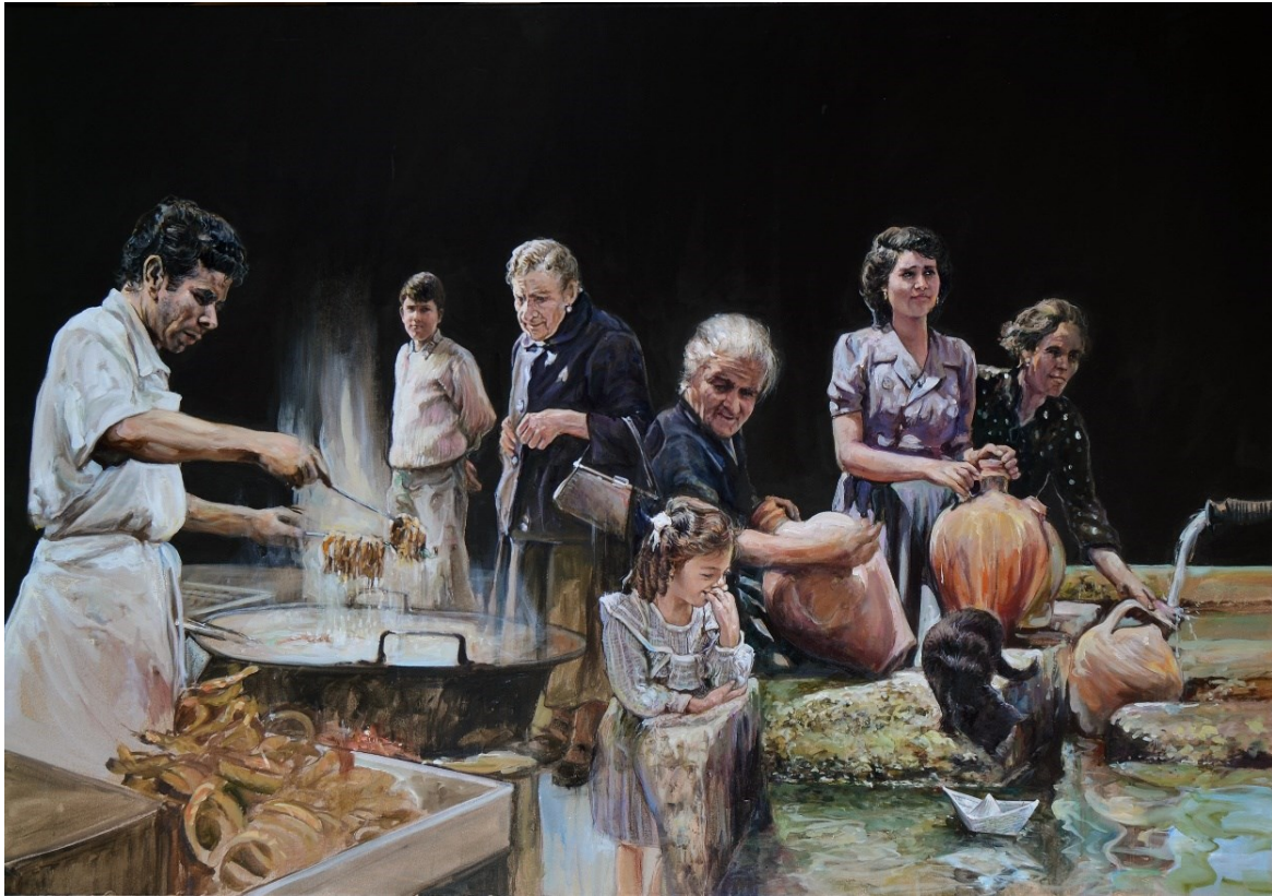
“PAISANAJE” . FINALISTA. Autor: ANTONIO VARAS DE LA ROSA