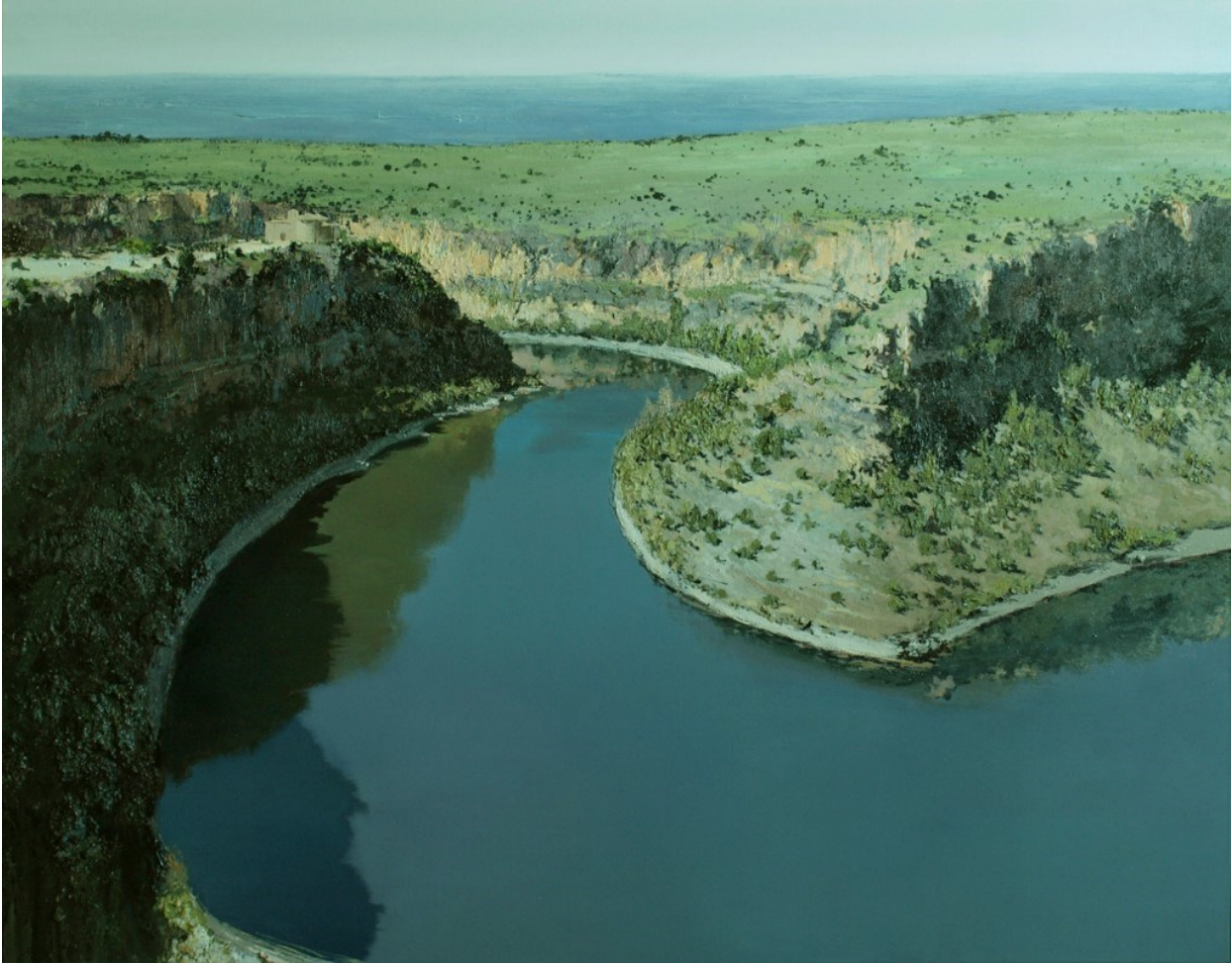
“HOCES” FINALISTA. Autor: ISIDORO MORENO